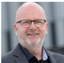
Jan Ivar Ingebrigtsen